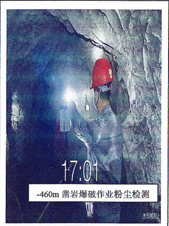
-460m 凿岩爆破作业粉尘检测