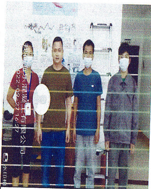
企业人员门口合照