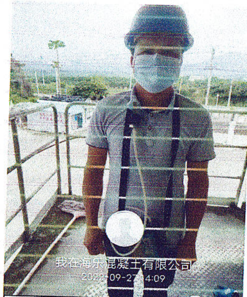
工人个体粉尘检测