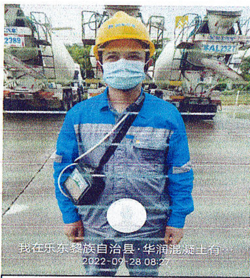
工人个体粉尘检测