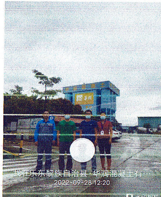
企业人员门口合照