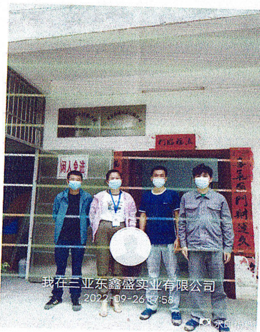
我在三亚东鑫盛实业有限公司 2022-09-26 17:58