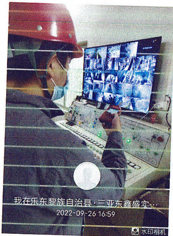
我在乐东黎族自治县·三亚东鑫盛实... 2022-09-26 16:59