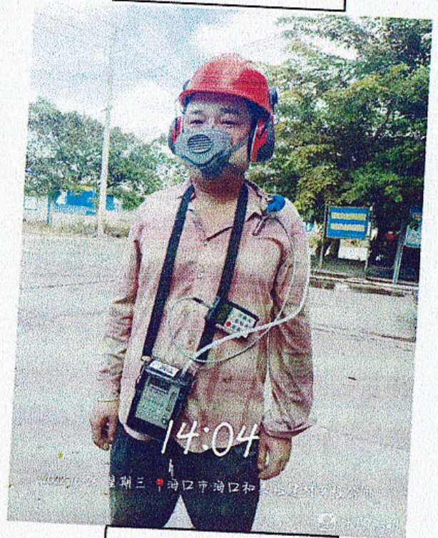
皮带巡检个体检测