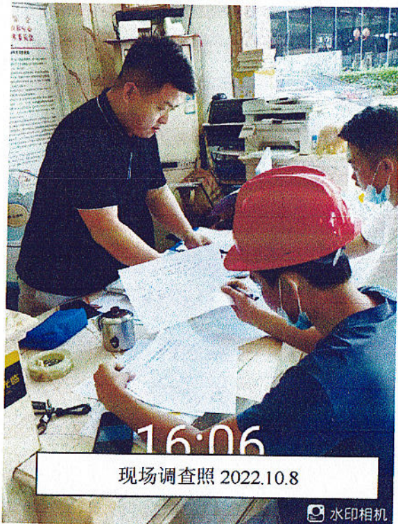
16:06 现场调查照 2022.10.8