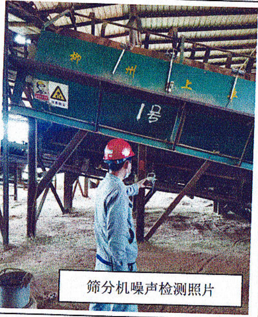
筛分机噪声检测照片