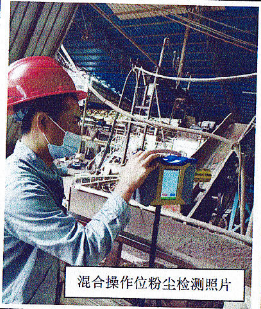
混合操作位粉尘检测照片