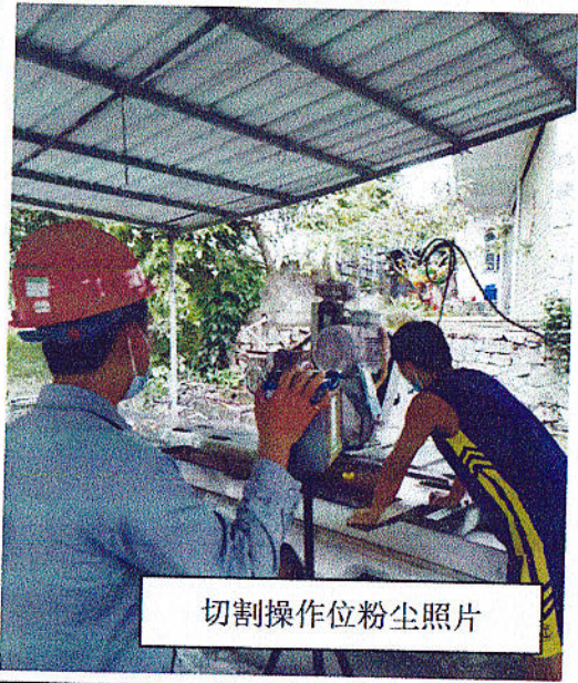
切割操作位粉尘照片