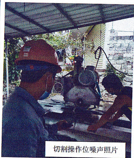
切割操作位噪声照片