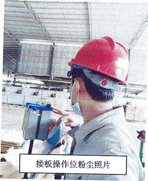
接板操作位粉尘照片