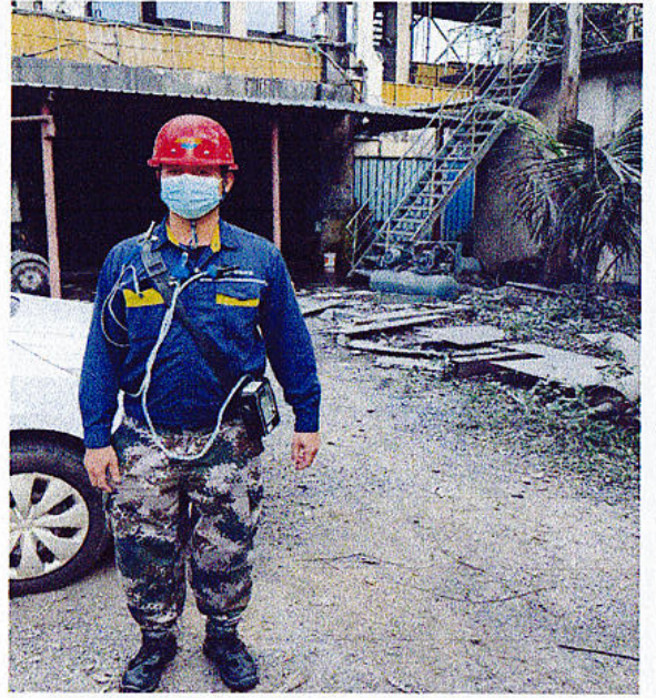
长皮带巡检工个体粉尘噪声检