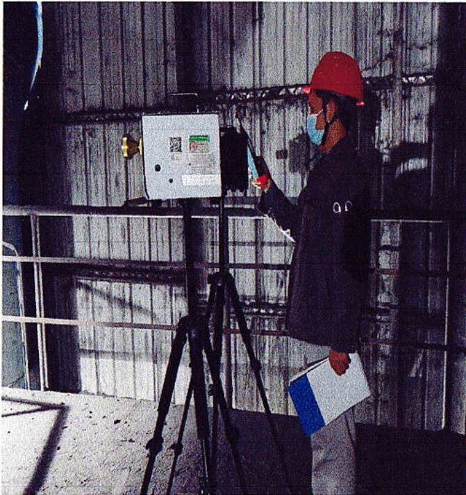
圆锥破 2 巡检位粉尘噪声检测