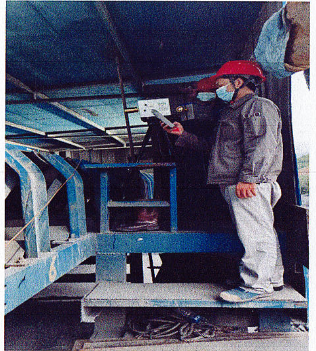
一破巡检位粉尘噪声检测