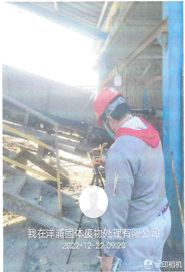
我在洋浦固体废物处理有限公司 2022-12-22 09:20