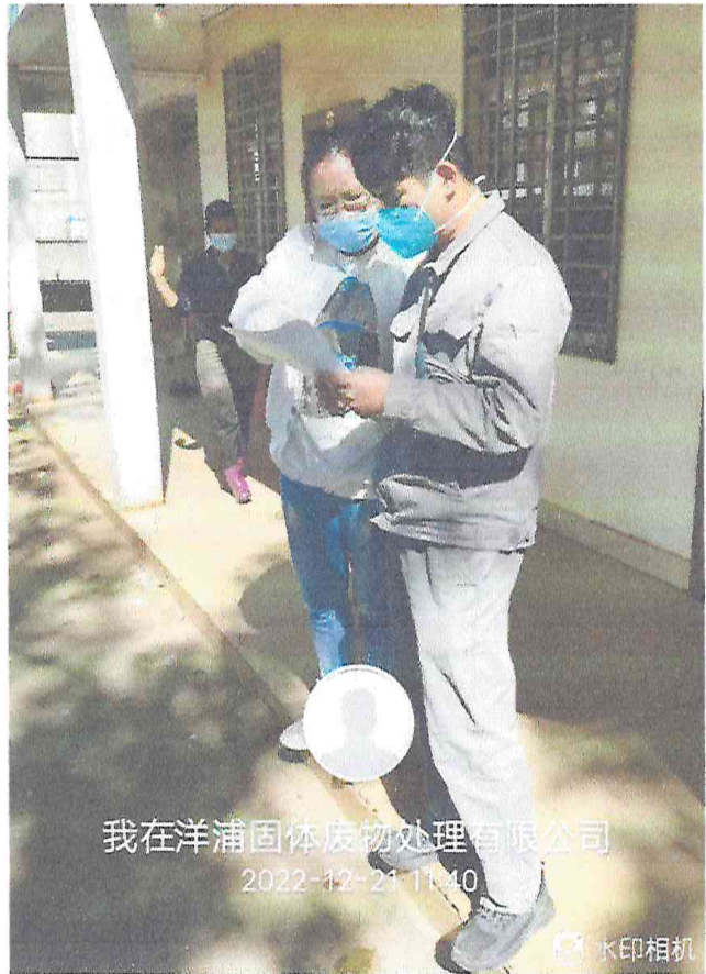
我在洋浦固体废物处理有限公司 2022-12-21 11:40