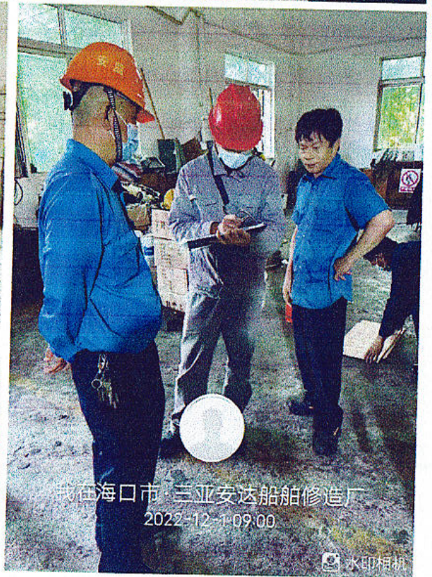
我在海口市·三亚安达船舶修造厂 2022-12-1 09:00