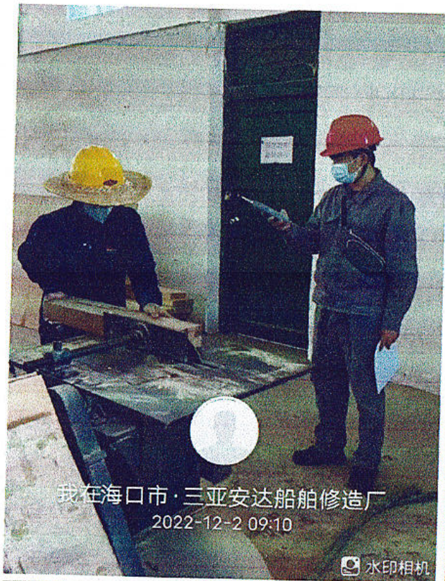
我在海口市·三亚安达船舶修造厂 2022-12-2 09:10