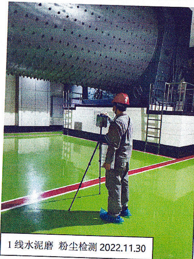
1 线水泥磨 粉尘检测 2022.11.30