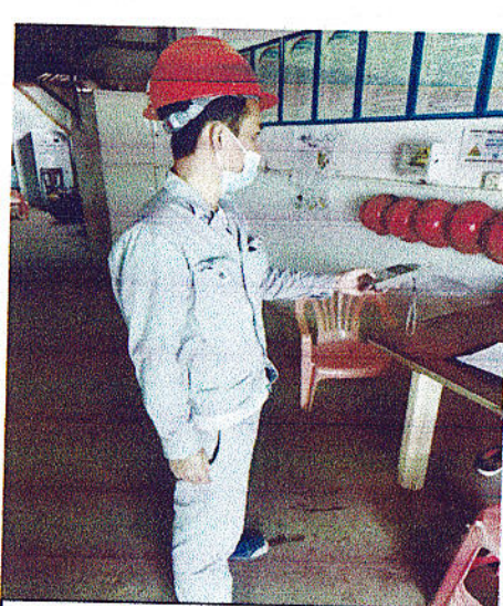
氨机房值班室噪声检测