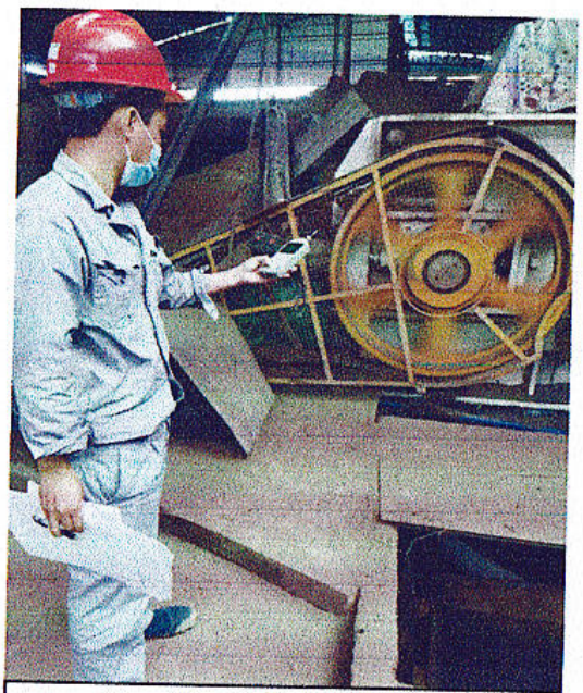
对辊巡检位噪声检测