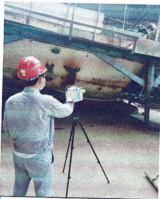
筛分巡检位粉尘检测