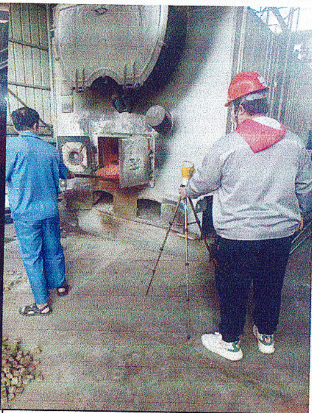
锅炉 粉尘检测 2022.12.13