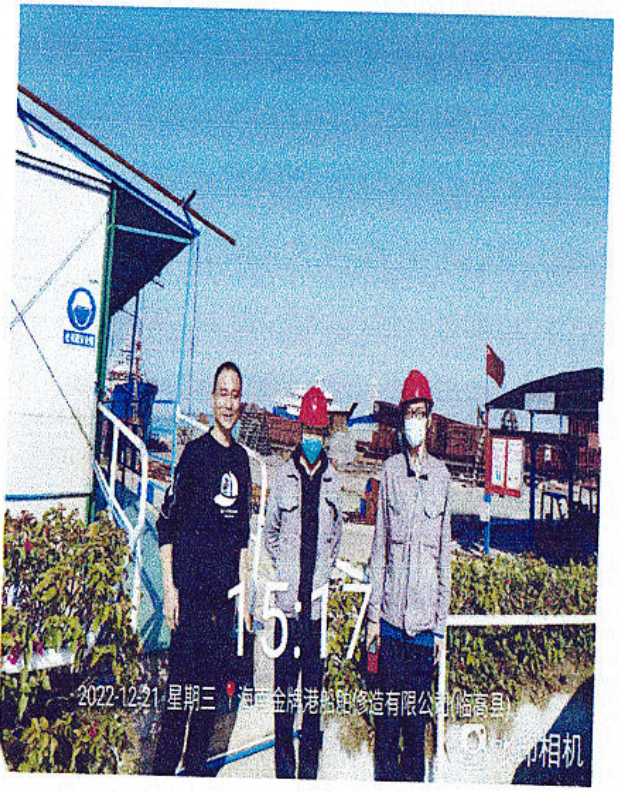
2022-12-21 星期三 海南金牌港船舶修造有限公司(临高县)