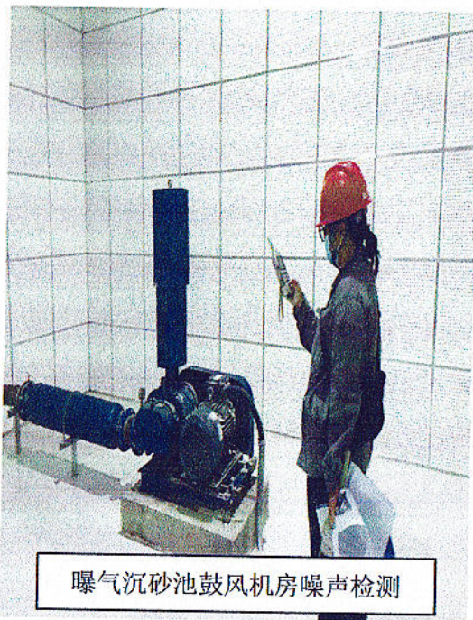
曝气沉砂池鼓风机房噪声检测