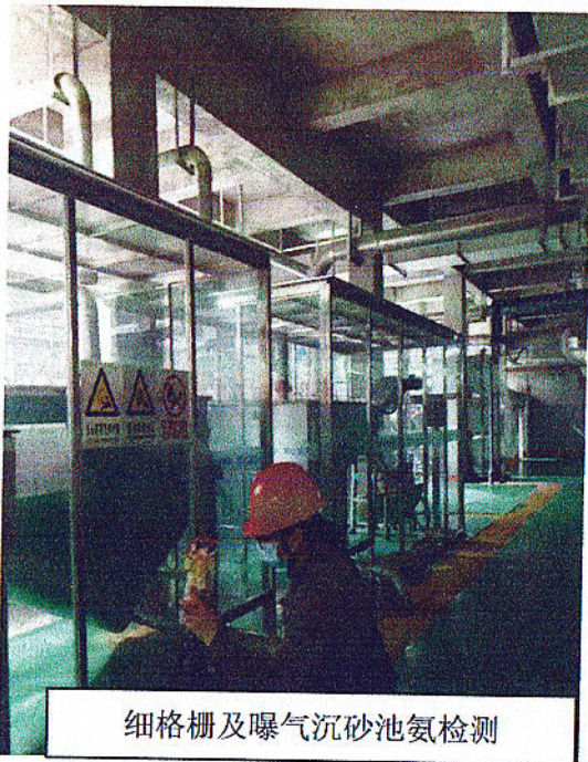
细格栅及曝气沉砂池氨检测