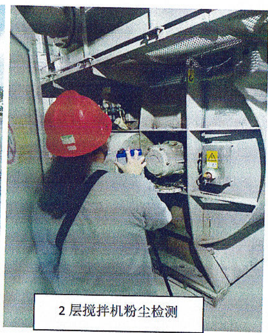
2层搅拌机粉尘检测