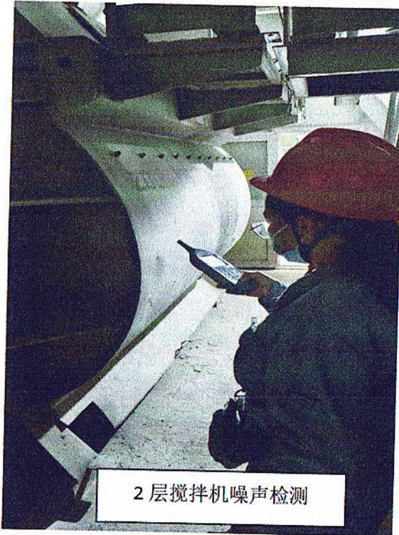
2层搅拌机噪声检测