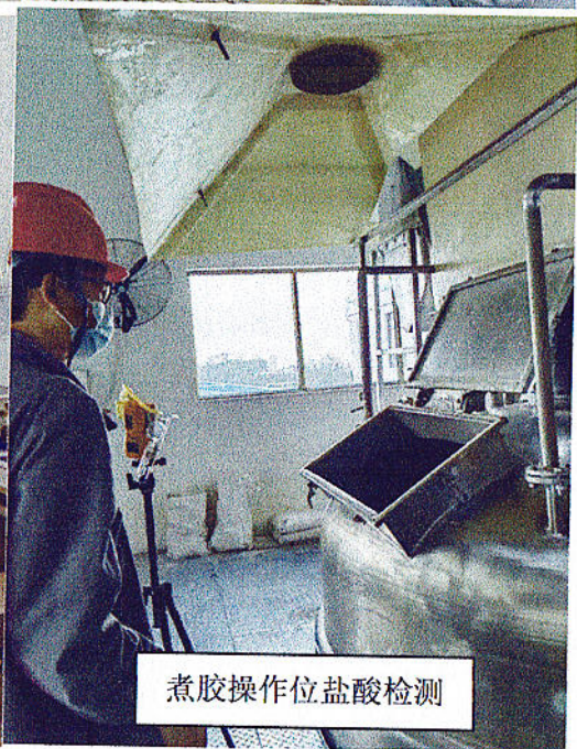
煮胶操作位盐酸检测