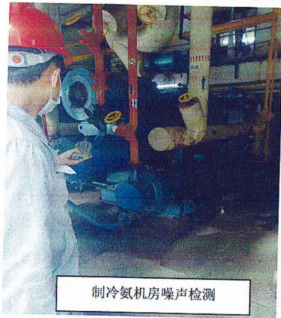
制冷氨机房噪声检测