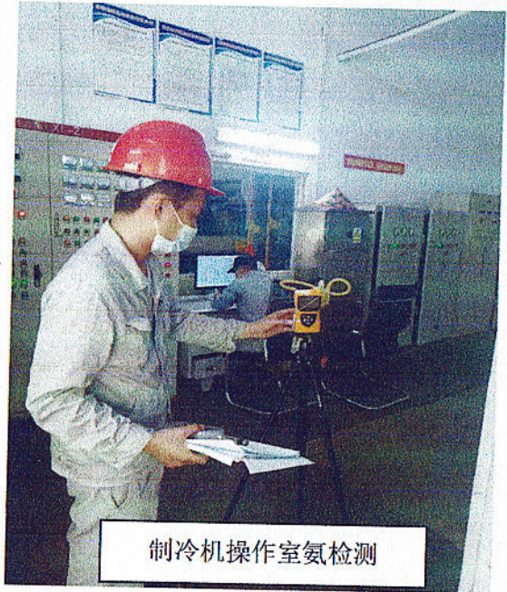
制冷机操作室氨检测