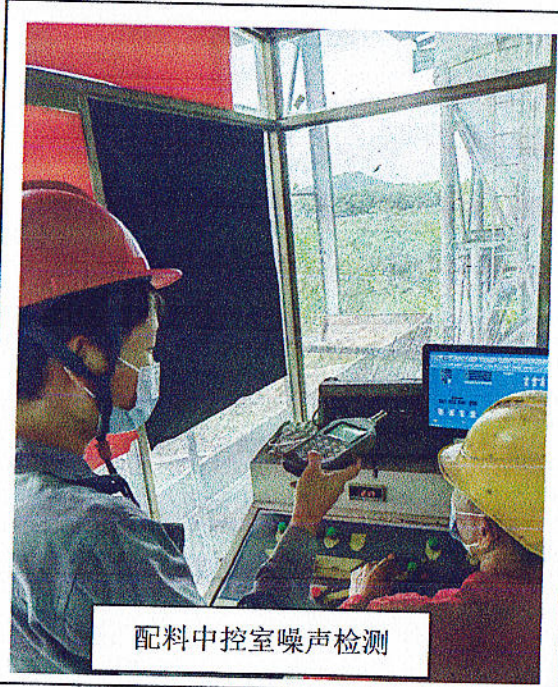
配料中控室噪声检测